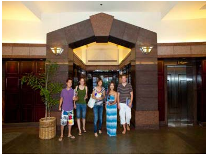
ロビー（エレベータは、写真の生徒さんたちの後ろにあります。）