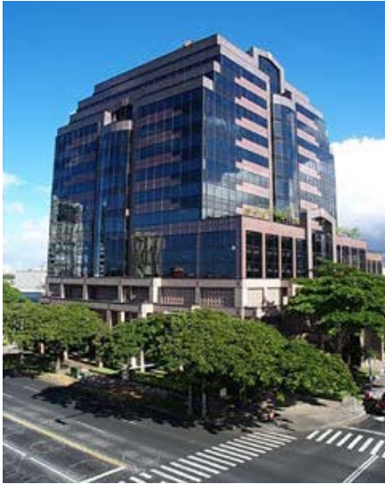
Pacific Guardian Tower